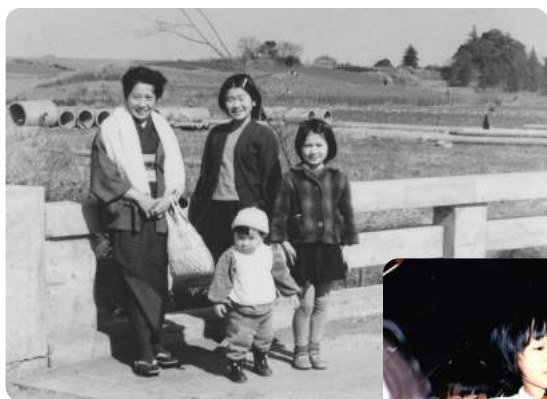
畑に囲まれた昭和30年頃