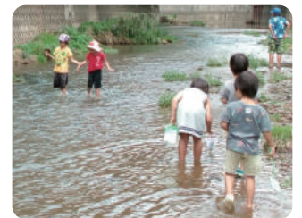
南田中国地付近で、石神井川に入る体験!

高稲荷公園は、都の計画で「重点的に整備する公園」に指定。また、かつて泳げた石神井川も今、住民の憩いの場となる整備が求められています。一体的な整備で、「石神井川で遊べる公園」に…ワクワクしませんか?